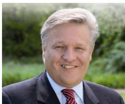
Wolfgang Spelthahn Landrat des Kreises Düren