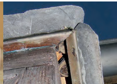
Zwergfledermaus im Größenvergleich; Fledermäuse sind in Spaltenquartieren nur schwer aufzufinden