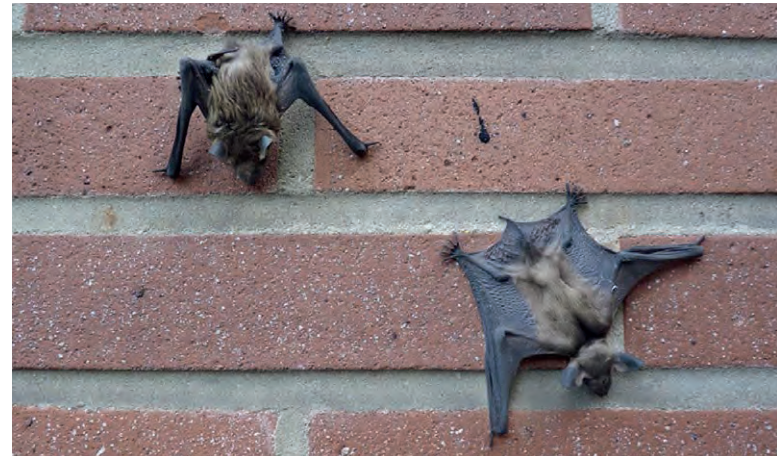
Junge Breitflügelfledermäuse