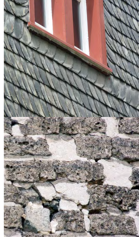
Einfluglöcher unter einer Schieferverkleidung im Bereich unter der Fensterbank und in einer Mauer, die jeweils von der Zwergfledermaus genutzt werden