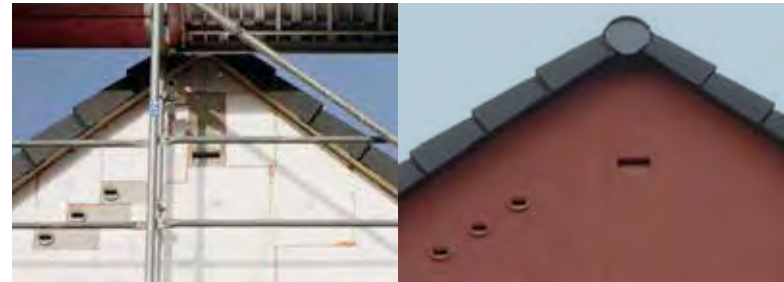
Beispiel für den Einbau eines Fledermausquartiers und dreier Quartiere für Mauersegler in die Fassade bei energetischer Sanierung