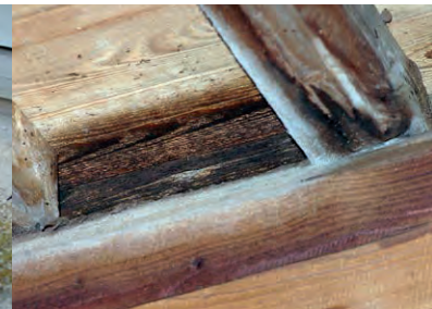
Fledermauskot auf einer Fensterbank und Verfärbung an Dachbalken