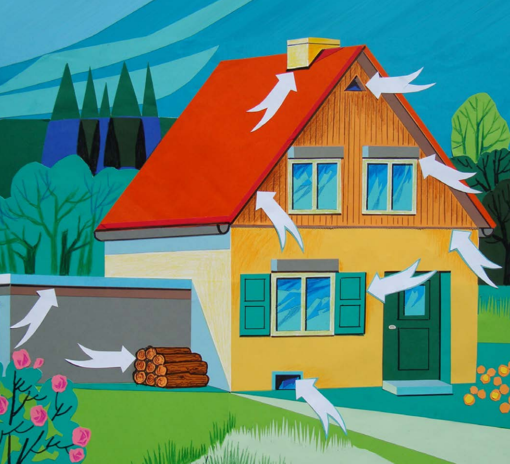
Beispiele für potenzielle Quartiere von Fledermäusen an Gebäuden