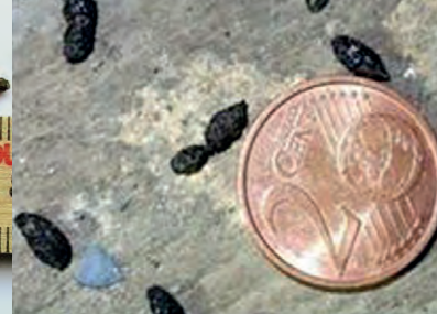
Mäusekot und Fledermauskot (4–10 Millimeter) im Vergleich von Aussehen und Größe (Quellen: J. Gerfried, H. Körber)