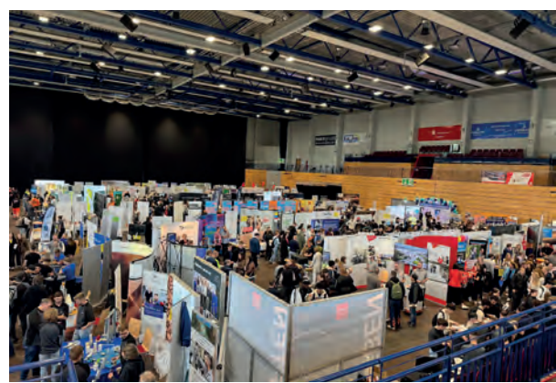
Die große Ausbildungsbörse findet in der Arena des Kreises Düren statt.

für das laufende Jahr sucht, hat vor Ort die Möglichkeit, direkt mit Unternehmen ins