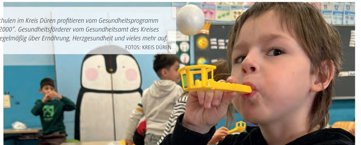
Grundschulen im Kreis Düren profitieren vom Gesundheitsprogramm „Klasse2000“. Gesundheitsförderer vom Gesundheitsamt des Kreises klären regelmäßig über Ernährung, Herzgesundheit und vieles mehr auf.