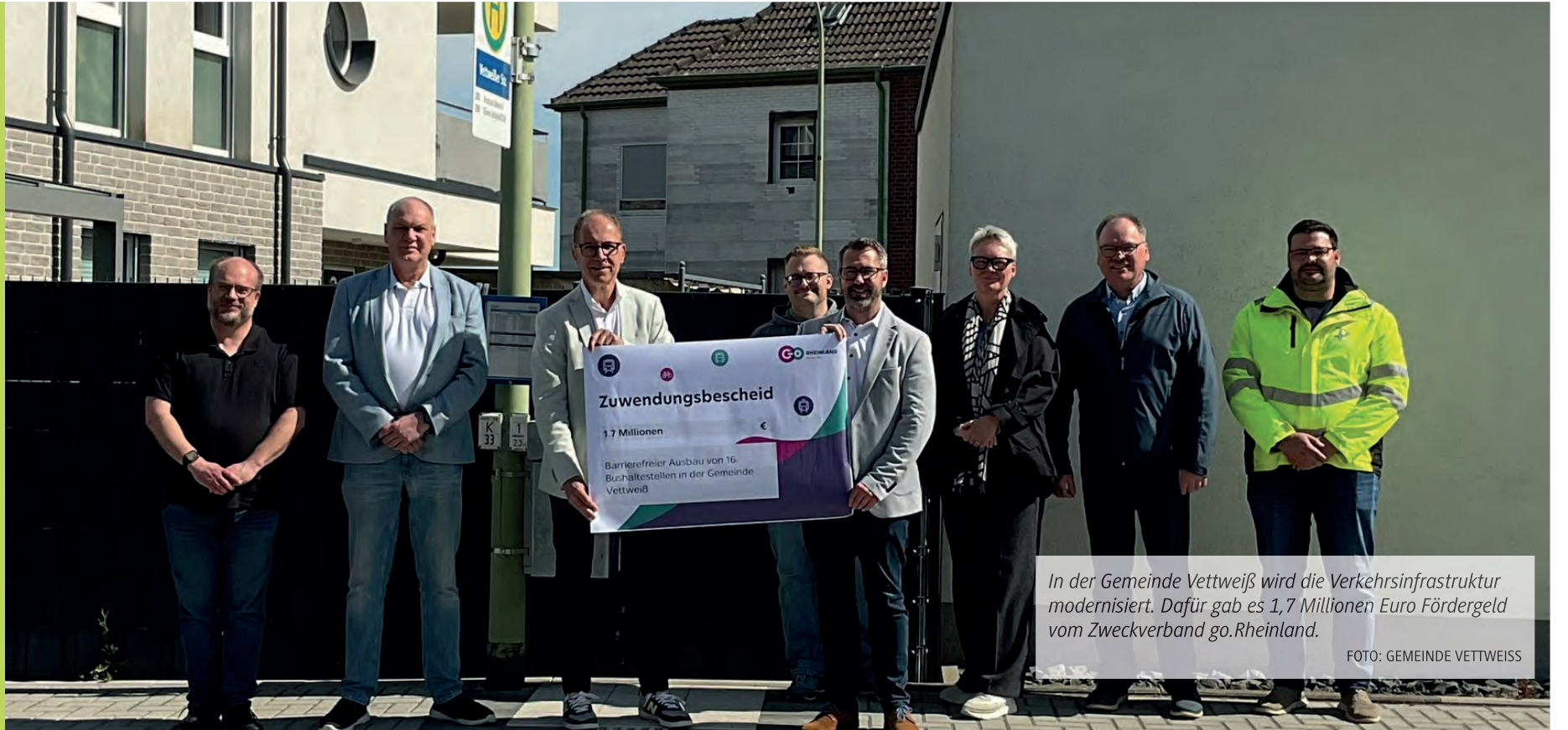
In der Gemeinde Vettweiß wird die Verkehrsinfrastruktur modernisiert. Dafür gab es 1,7 Millionen Euro Fördergeld vom Zweckverband go.Rheinland.